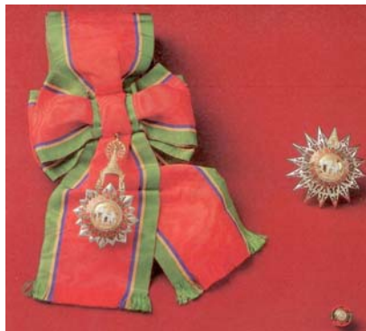
(๒) ประถมาภรณ์ช้างเผือก (ป.ช.)