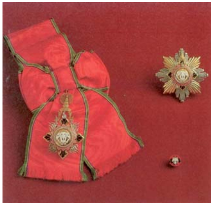
(๔) มหาปรมาภรณ์ช้างเผือก (ม.ป.ช.)