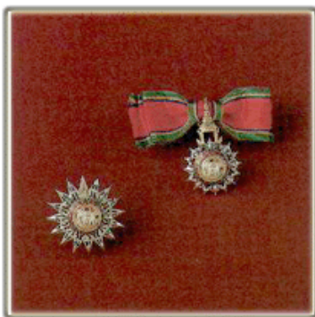
ทวีติยาภรณ์ช้างเผือก (ท.ช.) สตรี