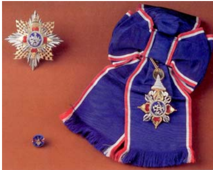
(๓) มหาวชิรมงกุฏ (ม.ว.ม.)