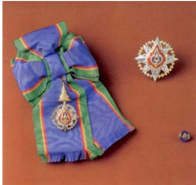
(๑) ประถมาภรณ์มงกุฎไทย (ป.ม.)