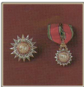
ทวีติยาภรณ์ช้างเผือก (ท.ช.) บุรุษ