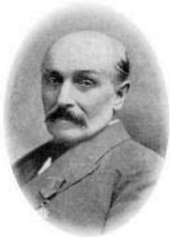
William Randal Cremer

และรายละเอียดอื่นที่สำคัญดังจะได้นำเสนอต่อไป