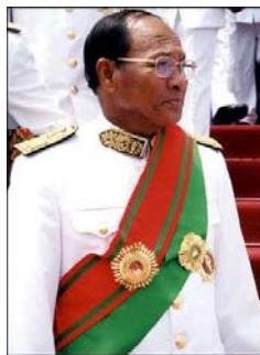
สมเด็จจ้อกรมหาพญาจักรี เฮง สัมริน ประธานสภาแห่งชาติ

ประธานสภาแห่งชาติแห่งราชอาณาจักรกัมพูชาคนปัจจุบันคือ สมเด็จจ้อกรมหาพญาจักรี เฮง สัมริน (Samdech Agga Moha Ponhea Chakrei HENG SAMRIN) โดยมีที่มาจากการเลือกตั้งของสมาชิกสภาแห่งชาติและมีวาระการดำรงตำแหน่ง ๕ ปี