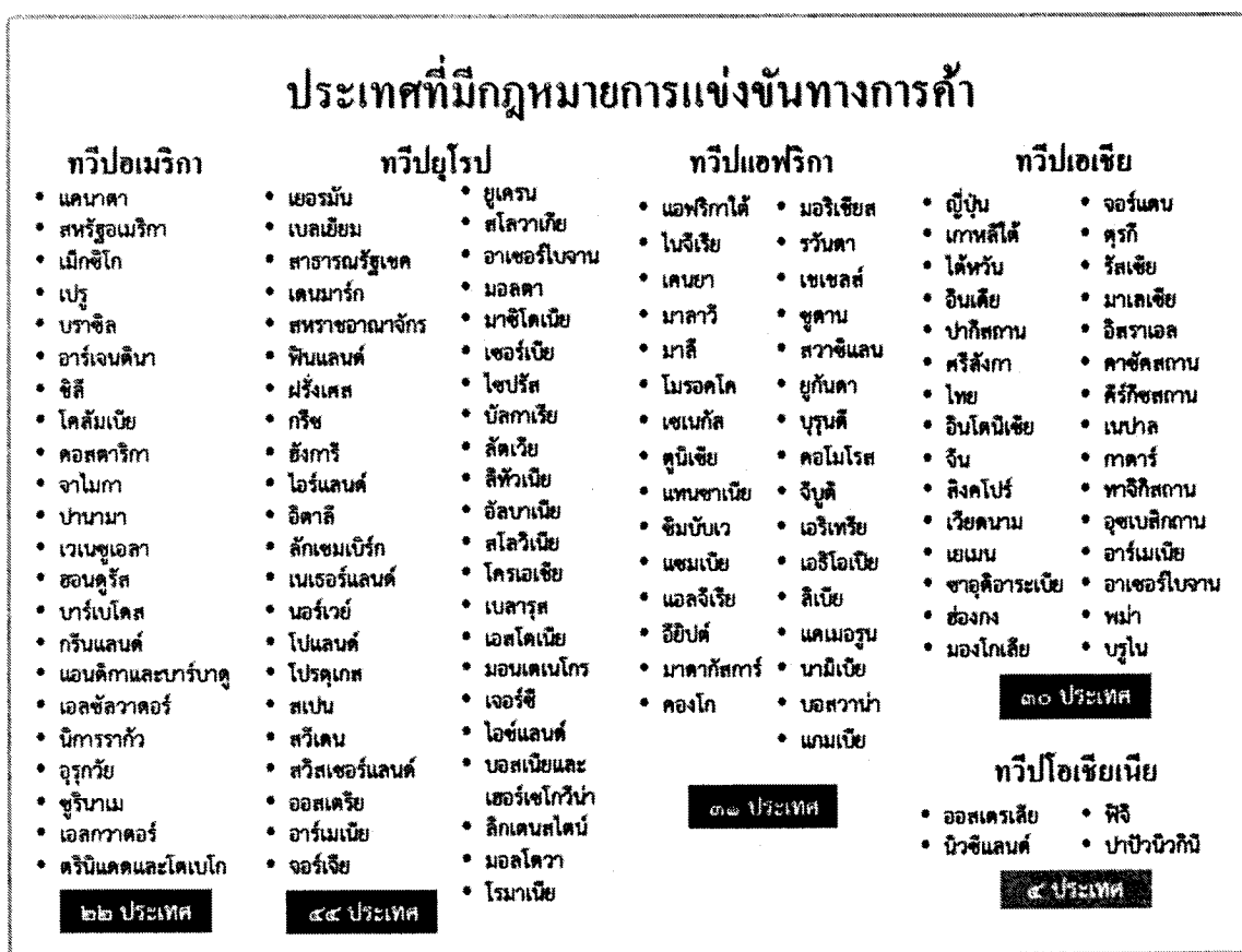
ภาพที่ ๒ ประเทศที่มีการบังคับใช้กฎหมายการแข่งขันทางการค้า